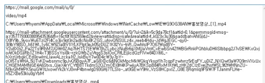
(그림 2) iedownload Database-설치파일 다운로드